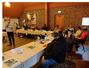
Foto's van de VR-bril tijdens de voorzittersbijeenkomst op 22 maart 2023